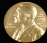
President Martti Ahtisaari was awarded the Nobel Peace Prize in 2008.

"I promised my support to the institute, if it is a part of normal activities and provides added value to the planned projects. I am glad that the University of Oulu is proceeding in economic and business sciences." (President Ahtisaari in the grand opening ceremony of the institute in 2008)