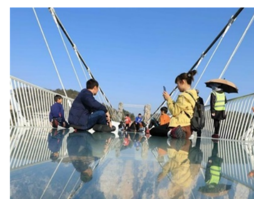
湖南张家界：初冬乐享户外运动