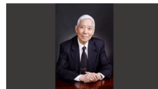
中国工程院院士陈灏珠逝世